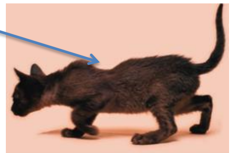
Figure 2 : Kyphose chez un chaton ( d'après K.Sturgess)